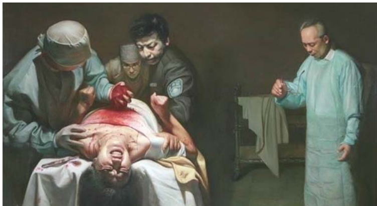
圖：油畫《活摘器官的罪惡》