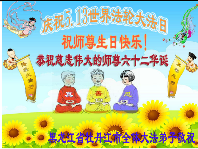
图：牡丹江大法弟子祝贺法轮大法日