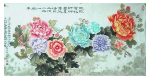
国画：敬贺师父传法 21 周年

这样的例子有很多，说也说不完。师尊佛恩浩荡，千言万语无法表达对师尊的感恩。（文／慧慧）◇