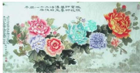
国画：敬贺师父传法 21 周年

这样的例子有很多，说也说不完。师尊佛恩浩荡，千言万语无法表达对师尊的感恩。（文／慧慧）◇