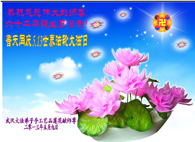
图：武汉大法弟子祝贺法轮大法日