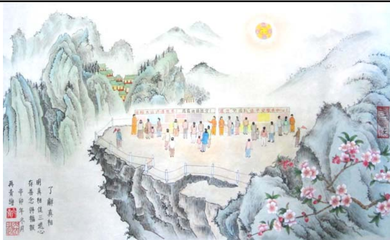
图：庆祝法轮大法日国画《了解真相》，作者：大陆大法弟子