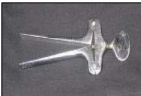
图：灌食用的开口器