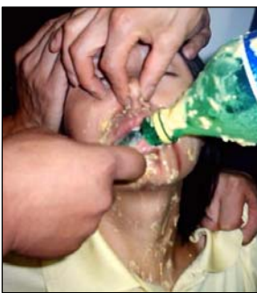
酷刑演示：灌食窒息