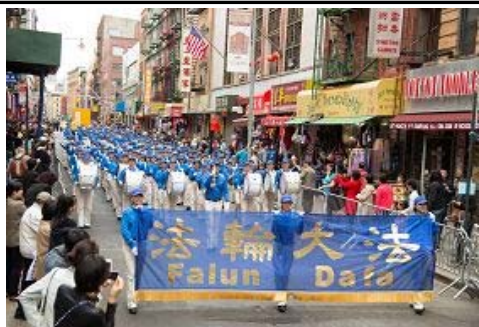
图：浩荡的游行队伍