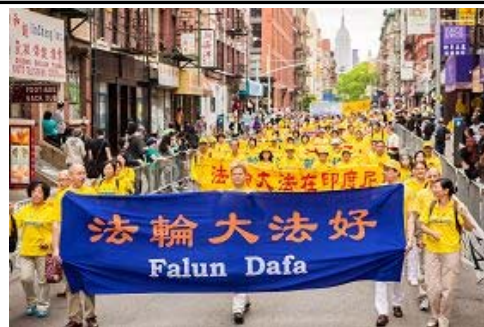
图：浩荡的游行队伍