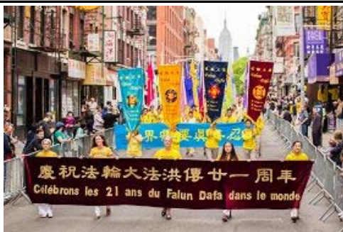
图：浩荡的游行队伍