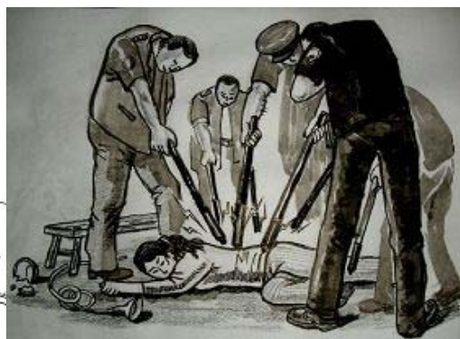
酷刑示意图：多根电棒电击