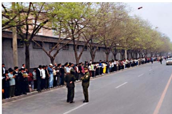
图片说明: 秩序井然的“四二五”上访民众对法轮功的迫害蓄谋已久。

1996年, 《光明日报》刊登诋毁法轮功的文章; 1998年, 时任中共政法委书记的罗干先定罪后调查, 先内定法轮功为“×教”, 再命令公安在全国“秘密调查”, 然而结果均是“未发现问题”。