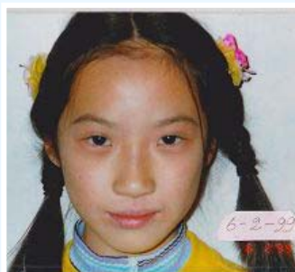
左：摄于1999年2月，长达四年的皮炎还相当严重。 上图：摄于1999年6月，皮肤奇迹般正常了。

二零一二年世界卫生组织在一项研讨会上警告，滥用抗生素已使得细菌的抗药性快速增加，一般的手术或轻微的感染都可能置人于死地，相当于现代医学的终结。今天，将我女儿的经历与您分享，也为您献上一份真诚的祝福。