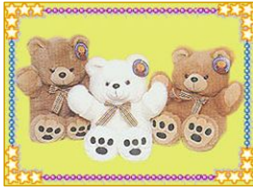
▲长富玩具公司的毛绒玩具

女劳教所三大队与上海三枪集团签约,三大队劳教人员被三枪公司包掉,作为三枪集团的工作人员。李