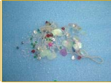
▲串细小的珠子制作装饰品