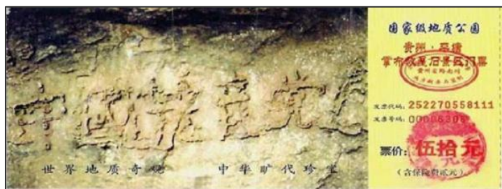
贵州省平塘掌布乡“藏字石”风景区的门票

至活摘器官等，使数以千万计的法轮功学员遭受不同程度的迫害，导致成千上万的善良之家破人亡；使中华大地笼罩在红色恐怖之中，处处腥风血雨。