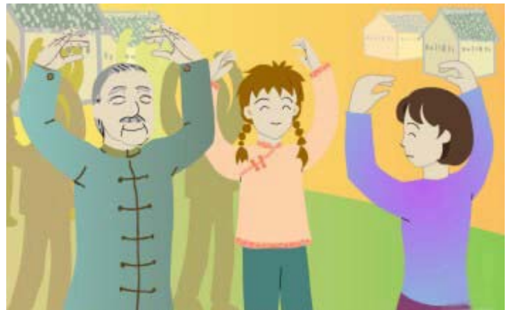
全村 300 人，有 80 多人每天参加集体读书、炼功

1998 年初，法轮大法（法轮功）传到了这个小村庄。全村 300 人，有 80 多人每天参加集体读书、炼功，自觉地不再干偷盗的事了。在这些人的带动下，这里的偷盗风得到了彻底的改变。这一年的冬天，村民们派代表，到广州参加法轮功修炼心得交流会，谈了他们变化的经过。这位农村学员谈到：“以前不知这个理，以为公家的东西不拿白不拿，你不偷他也偷。现在知道‘不失不得，得就得失’的理。宁江镇政府一位干部深有感触地说，你们法轮功真是太好啦，起到了法律起不到的作用，我也要买一本你们的书看看。”