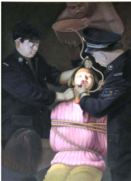
酷刑演示：野蛮灌食（绘画）

后又被关在楼梯内禁闭室。由于她不配合邪恶，多次被非法延期，长期关禁闭室。梅雨天，水泥地上都渗水，劳教所不给床睡，就让她睡在地上铺的一块木板上，木板和被子都是潮湿的。