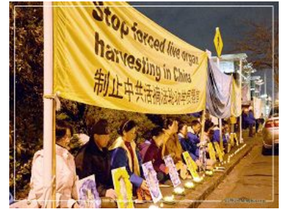
图：奥克兰法轮功学员在中领馆前举行烛光夜悼活动，抗议中共迫害

【明慧网】二零一三年七月十九日晚，新西兰奥克兰法轮功学员来到 Great South 路的中领馆前，以烛光悼念的方式缅怀被中共迫害致死的中国大陆同修，同时抗议中共对法轮功长达十四年的残酷迫害。