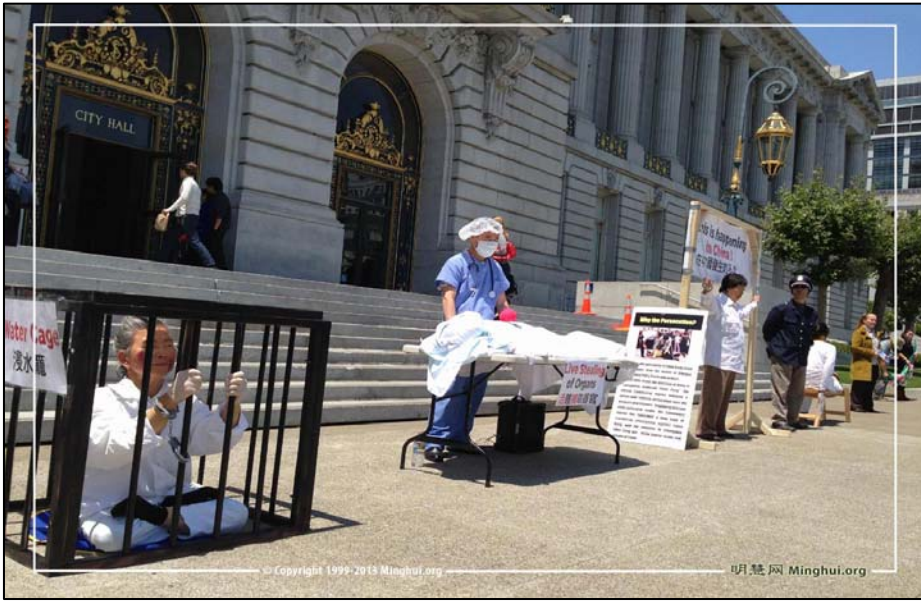
图：旧金山法轮功学员在市政府前举办真人演示的“反酷刑展”，揭露中共迫害，呼吁制止迫害。