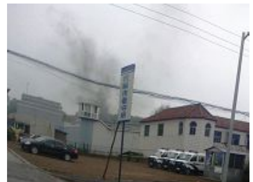
庭审法轮功学员用的警车