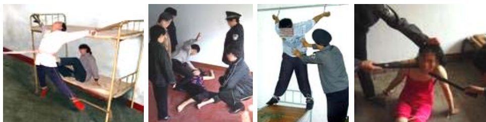
迫害法轮功学员酷刑演示图（从左到右为）：捆刑、毒打、吊铐、电击