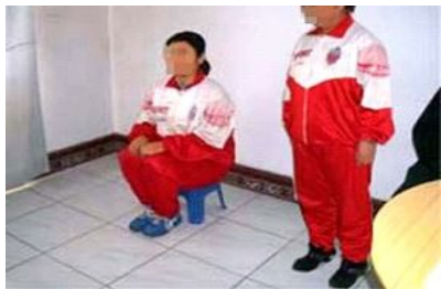
长时间罚坐小凳子

劳教所是人间地狱，用种种手段迫害大法弟子。常常强迫做“体操”、“军训”，除此之外，还强迫坐小板凳，从早晨一直坐到晚上十点钟，双眼必须平视，不能向其它方向看，双手必须放在膝盖上，不合要求，就会