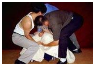
中共酷刑演示：棉被捂