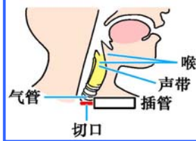
气管切开插管示意图

国际教育发展组织（IED）2001年8月14日在联合国会议上，就“天安门自焚事件”强烈谴责中共的“国家恐怖主义行为”，声明说：从录像分析表明，整个事件是“政府一手导演的”。中共代表团面对确凿的证据，没有辩辞。该声明已被联合国备案。◇