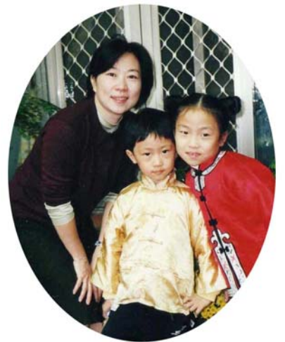
美满与儿女的合照

足,“我应该只问自己做得好不好,何必去计较他人的作为,我的心胸更加宽广坦荡,活得轻松愉快。”◇