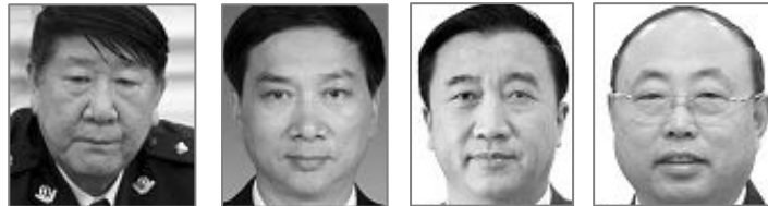
迫害负责人：左起辽宁省司法厅厅长张凡、副厅长崔可兵、监狱管理局局长单成繁、政委黄涛