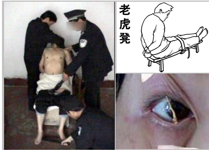
酷刑图：电击、老虎凳、牙签支眼睛不许睡觉

近期，沈阳第一监狱成立了“高戒备监区”，更严酷迫害大法弟子。狱警把这些大法弟子关在封闭的屋子里，逼迫大法弟子放弃信仰，恶警采用的酷刑手段是：坐老虎凳、往眼睛里喷辣椒水、用牙签支眼皮不让睡觉、用小太阳（电暖器）