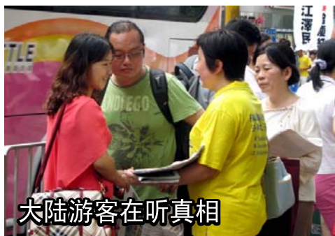
大陆游客在听真相