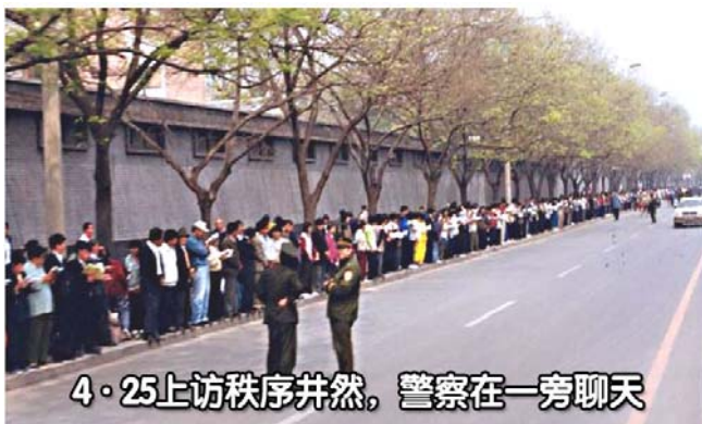
4·25上访秩序井然，警察在一旁聊天

1999 年 4 月，中共政法委书记罗干的连襟何祚庥在《青少年科技博览》上发表诬陷法轮功的文章。4 月 24 日，天津法轮功学员去杂志社澄清事实，却遭殴打和非法抓捕。天津公安