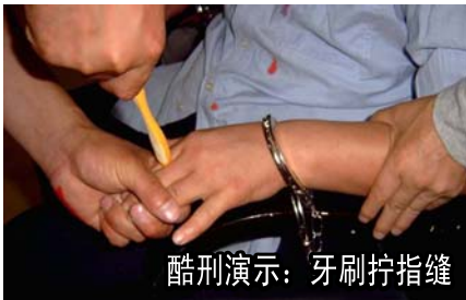
酷刑演示：牙刷拧指缝