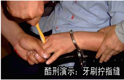
酷刑演示：牙刷拧指缝