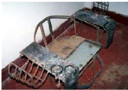
中共迫害法轮功学员的刑具：铁椅子

宣化看守所的背铐是一种非常残酷的刑具，它不是正规的手铐，是两个 U 形铁环，两头有孔，中间用一根铁棍穿过，再用锁子锁上，人戴上这种背铐，最多两个小时，手铐会深深勒进肉里，手就会肿胀起来，令人疼痛难忍。铁椅子是一种铁制的椅子，人被关在里面双腿动弹不得，时间长了腿都肿起来，放下来不能正常行走。