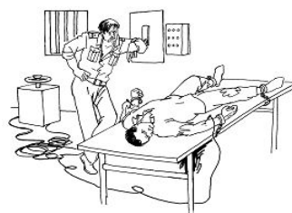
洗脑班的酷刑种种：铁椅子 电刑 吊铐