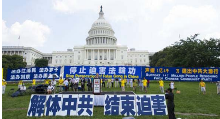
图：2013 年 7 月 18 日约 1500 名法轮功学员在美国首都国会山前举行反迫害 14 周年集会，多位国会议员到场声援。

维斯特摩尔指出，中共政权的人权记录骇人听闻，它不再仅仅是中国的“内政问题”。中共政权迫害法轮功，证据确凿。同样清楚的是，被监禁的法轮功修炼者遭受了最令人毛骨悚然的对待，包括未经审判被关进劳教所，及被杀害，仅仅是为了获取他们的肾脏、肝脏、心脏、肺和眼角膜等器官。到今天，中共仍在变相地继续逮捕、监禁和杀害法轮功修炼者。