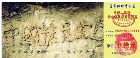
图：2002年6月，贵州平塘县掌布乡发现了距今二亿七千万年的“藏字石”，石头断面上显现“中国共产党”六个大字，上图为风景区门票。