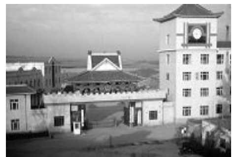
人间地狱——黑龙江女子监狱

我面对这冷冷的气氛，这忧伤、这压抑、这疲倦，我还是想出去，想回家，希望生活在自由中，逃出这没有自由、没有尊严、没有人格、让人沉重的人间地狱。◇