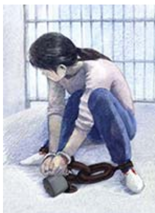
酷刑演示（一）：手铐脚镣

据悉“洗脑班”所劫款项，临沂市“六一零”与临沂市水利技校分成，如此一来临沂市“六一零”与临沂市水利技校着实发了一笔横财。水利技校有 7、8 个教师被“聘”为洗脑班的工作人员参与迫害。这些人只图眼前利益，不顾良知，