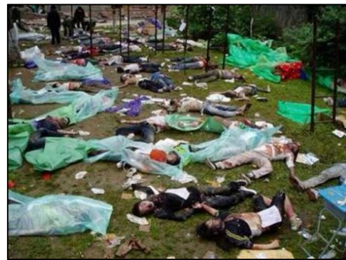
▲国内网友发的网络图片

一位法轮功学员的母亲，看到涨水出去关大门，结果被洪峰冲走，老太太顺手抓到一捆东西抱住，由于老人被惊吓，都记不清报的是什么东西了，老太太顺水漂了两里多地，漂到一棵树旁，老人搂住树枝，之后被人救上岸。七十多岁的老太太这样神奇得救。这位法轮功学员家大水只到他