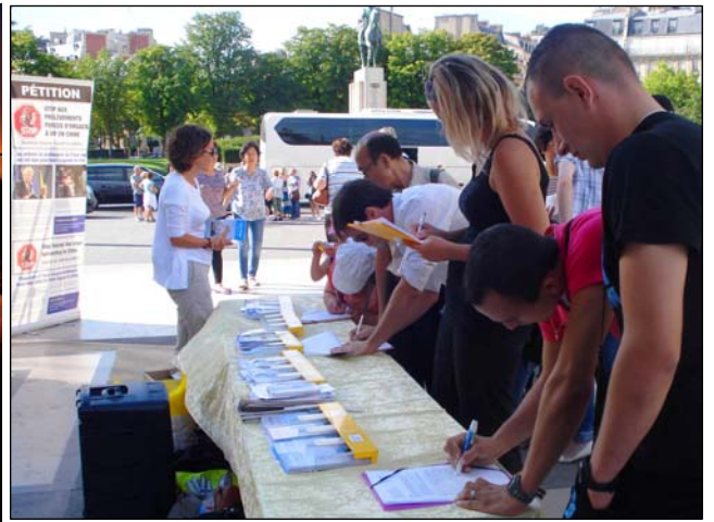
左：《国家掠夺器官》揭活摘器官黑幕 右：巴黎人权广场上人们签名谴责中共活摘器官

官移植数量远远高于大陆的死囚数量，2000 年至 2005 年，中国器官移植数量比死囚数量多出 41500 起，据调查其中大部分器官来自被非法关押的法轮功学员。）