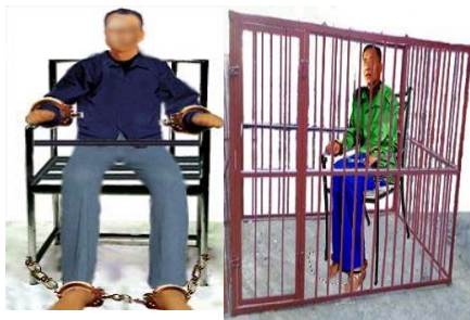
酷刑演示：铁椅子、铁笼子

在潍坊市洗脑班，法轮功学员被铐着坐铁椅子几天几夜、甚至二十几日夜，更加野蛮的是，法轮功学员不光受铁椅子、铁笼子酷刑，还要同时遭受几天甚至二十几天不让睡觉、不让躺，并同时遭受暴力刑讯逼供。