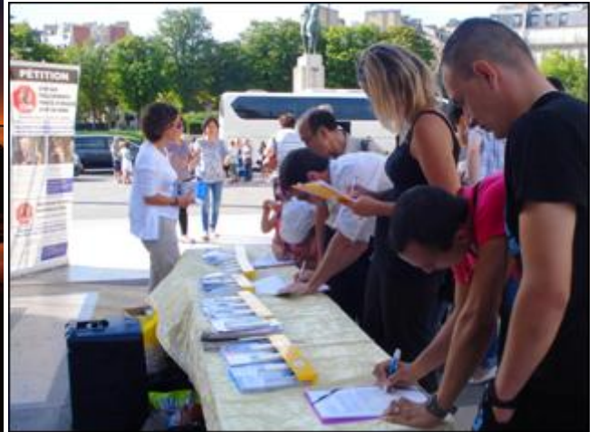
左：《国家掠夺器官》揭活摘器官黑幕 右：巴黎人权广场上人们签名谴责中共活摘器官

官移植数量远远高于大陆的死囚数量，2000 年至 2005 年，中国器官移植数量比死囚数量多出 41500 起，据调查其中大部分器官来自被非法关押的法轮功学员。）