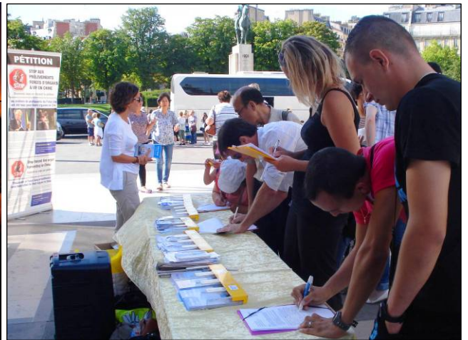
左：《国家掠夺器官》揭活摘器官黑幕 右：巴黎人权广场上人们签名谴责中共活摘器官

官移植数量远远高于大陆的死囚数量，2000 年至 2005 年，中国器官移植数量比死囚数量多出 41500 起，据调查其中大部分器官来自被非法关押的法轮功学员。）