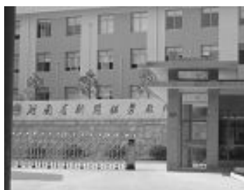
新开铺劳教所（湖南开关厂内）

十四年来，新开铺、白马垅两劳教所，毫无人性的迫害法轮功学员，滔天罪行罄竹难书，所曝光的案例仅是冰山一角。现两劳教所正在解体，其迫害罪行终将被一一清算。