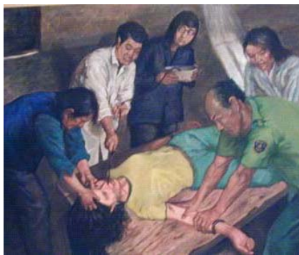
酷刑图示：野蛮灌食