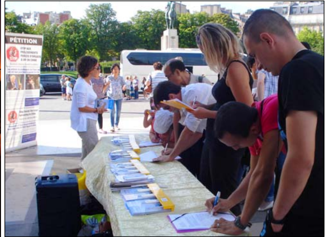
左：《国家掠夺器官》揭活摘器官黑幕 右：巴黎人权广场上人们签名谴责中共活摘器官

官移植数量远远高于大陆的死囚数量，2000 年至 2005 年，中国器官移植数量比死囚数量多出 41500 起，据调查其中大部分器官来自被非法关押的法轮功学员。）