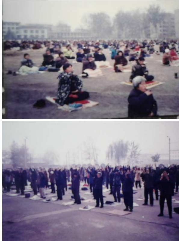
珍贵的历史记载：1998年秋季，安阳近千名法轮功学员在南关体育场集体炼功

顺应天意，国泰民安，逆天叛道，天呈异象。窦娥屈死，六月飞雪，三年大旱；大法与法轮功学员蒙难，善恶的选择与每个人的命运息息相关。各级“六一零”、公安等参与迫害法轮功学员的恶人遭报应的越来越多。仅在明慧网上公开曝光的已有一万多例。指出这些不是幸灾乐