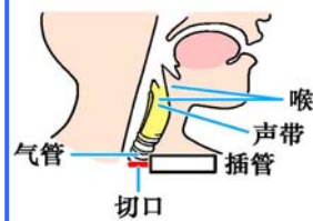
气管切开插管示意图

国际教育发展组织（IED）2001年8月14日在联合国会议上，就“天安门自焚事件”强烈谴责中共的“国家恐怖主义行为”，声明说：从录像分析表明，整个事件是“政府一手导演的”。中共代表团面对确凿的证据，没有辩辞。该声明已被联合国备案。◇