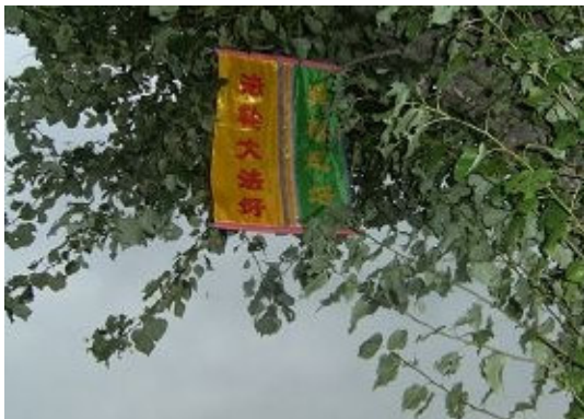
二零一三年“五一三”期间，盘锦市兴隆台某小区内出现的大法真相条幅。

大法弟子按照真、善、忍的标准做好人，向世人讲真相是为了救度民众，是大善之举，同时也是完全合法的，那些参与迫害大法弟子的人将来不但受到上天的惩罚，也将受到法律的严惩，只有停止迫害，将功补过，才会拥有未来！◇