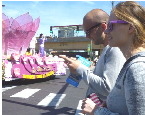
接到真相传单的游客用手机拍照发短信