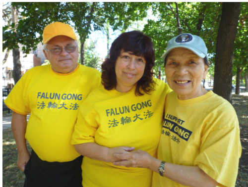
乔治和玛丽娜夫妇与华人法轮功学员