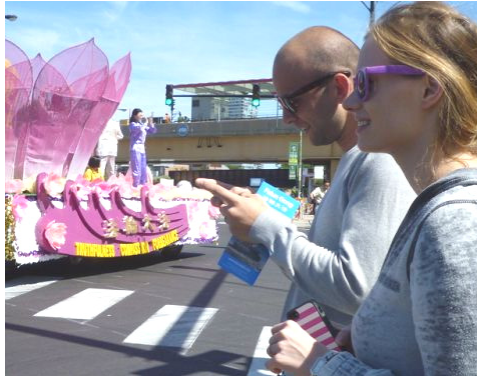
接到真相传单的游客用手机拍照发短信