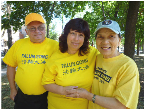
乔治和玛丽娜夫妇与华人法轮功学员