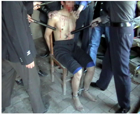
酷刑演示：电棍电击

性的地步，他们训练有素，知道往哪打可以伤到人的要害，伤到暗处，又不留下痕迹，他们想用电棍电我的生殖器，又说把电棍塞进我的嘴里……恶警们用两根电棍同时对准我双脚的涌泉穴，不停地电击，我被电得惨叫划破了夜空，当时只觉得被电得闭着眼都能看到一道蓝光直冲头顶，就象被狂风暴雨中的电闪雷鸣击中一样，那种痛苦，是难以描述、常人难以忍受的。