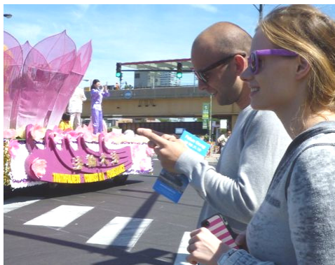
接到真相传单的游客用手机拍照发短信