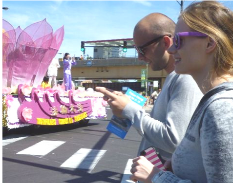
接到真相传单的游客用手机拍照发短信