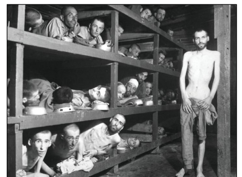
被解救的布痕瓦尔德集中营囚犯

1945 年 4 月的德国魏玛。在这座以巴赫的音乐、歌德的小说、席勒的诗篇以及包豪斯的建筑而闻名世界的城市中，却有着一座纳粹