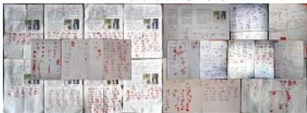
又有 939 人再度联名呼吁营救唐山李珊珊