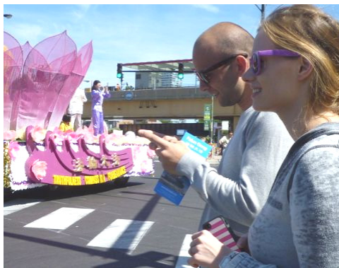
接到真相传单的游客用手机拍照发短信