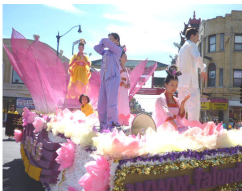
在莲花车上演示法轮功五套功法

如今，法轮大法已弘传世界一百多个国家，受到世界人民的喜爱，因为对人类身心健康做出的杰出贡献，获各国政府褒奖、支持议案、支持信函三千多项。（文／舒静）◇