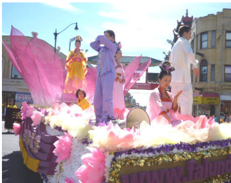
在莲花车上演示法轮功五套功法

如今，法轮大法已弘传世界一百多个国家，受到世界人民的喜爱，因为对人类身心健康做出的杰出贡献，获各国政府褒奖、支持议案、支持信函三千多项。（文/舒静）