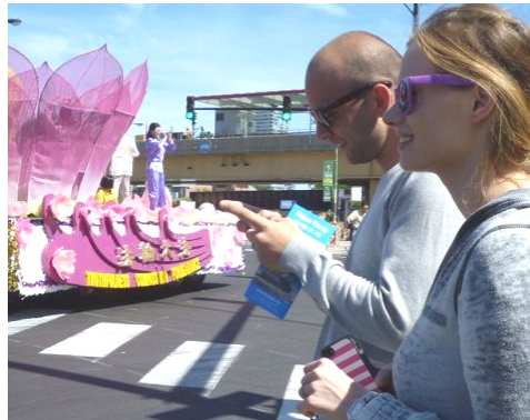
接到真相传单的游客用手机拍照发短信