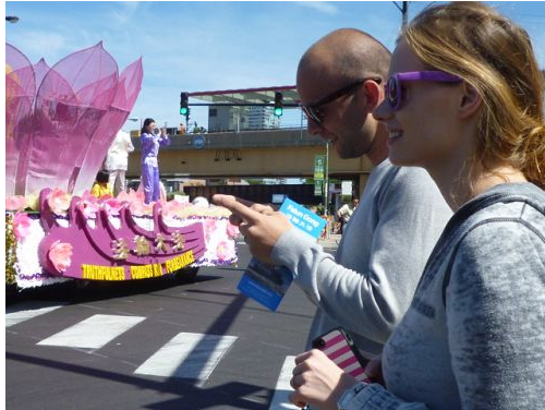
接到真相传单的游客用手机拍照发短信