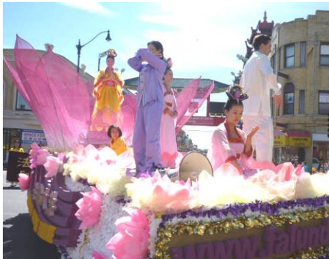
在莲花车上演示法轮功五套功法

如今，法轮大法已弘传世界一百多个国家，受到世界人民的喜爱，因为对人类身心健康做出的杰出贡献，获各国政府褒奖、支持议案、支持信函三千多项。（文/舒静）◇