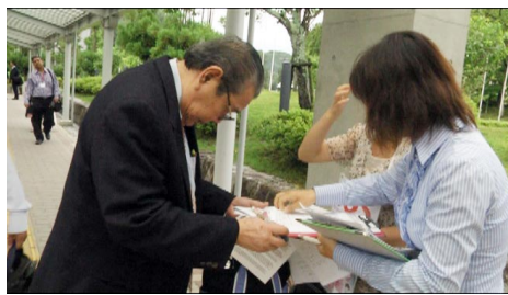
在移植大会入口处征集反迫害签名

许多参加会议的各国医师都很关注这个事，纷纷向麦塔斯咨询自己的疑问。一位日本大媒体的记者专程坐新干线一个多小时，从东京来到京都的会议现场，对麦塔斯进行了近两个小时的采访，并表达了自己的敬