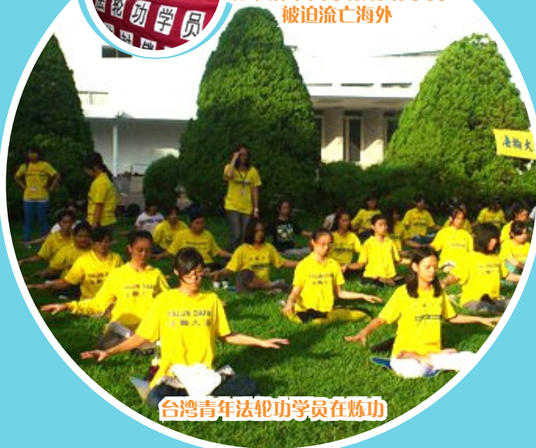
台湾青年法轮功学员在炼功