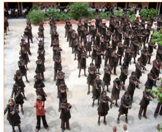
▲ 仅在印度的班加罗尔这一座城市，就有 80 多个学校的师生炼法轮功。