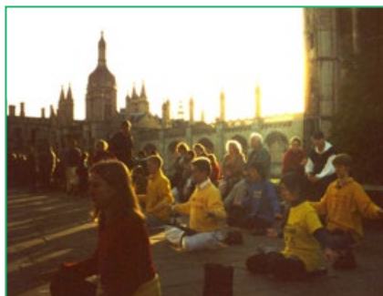
▲ 剑桥大学法轮功学员在炼功

举世闻名的剑桥大学是现代科学的发源地之一，有着历史悠久的文化气息。法轮功特有的清新纯正、优美的功法和强身健体的神奇功效，深受这所顶尖学府的欢迎。