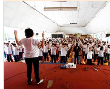
▲ 左图为西班牙萨拉戈萨市公立学校中学师生们一起学炼法轮功，右图为印尼苏西天主教高中学校学生在学炼法轮功。