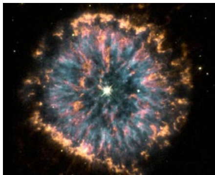
▲ 上图为哈勃太空望远镜拍摄到的遥远星云照片，这张照片被称为“天体之眼”。

无独有偶，英国剑桥大学天文研究所的专家发现，他们的软件可以应用于病理学上的细胞组织切片的染色分析。为了研究癌症等难题，医学人员准备了成千上万的细胞组织切片染色，但是它们明暗不一，形状各异，大小不同，再加上各种背景染色的干扰，这么多数据分析起来很令人发愁。幸运的是，剑桥