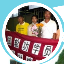
北京清华大学法轮功学员 被迫流亡海外