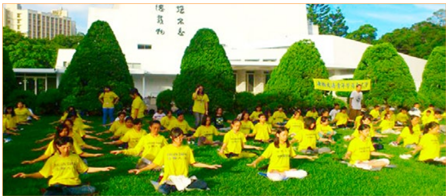
▲在台湾，法轮功修炼者达几十万人。图为部分台湾青年学子在集体炼功。

台湾清华大学于 1956 年在新竹复校，培育无数人才，在国际上也享有盛名。如今，在台湾清华大学的校园，有一道独特的风景：每到中午，在美景如画的成功湖畔，都会看到清华大学的法轮功修炼者宁静祥和的炼功场景；每逢清华的重要庆典，都可看到摆设整齐的法轮功真相展板。