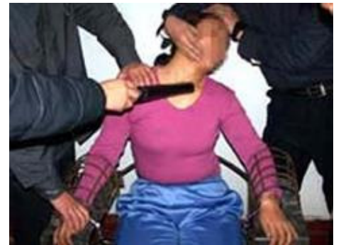
酷刑演示：绑在铁椅子上电击