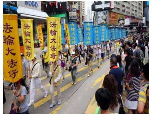
图：由天国乐团引领的游行队伍，震撼港民与游客围观，不少人拿起相机、手机拍照。

港岛区闹市，穿越港岛闹市主要街道，沿途吸引广大民众以及游客围观与关注，纷纷表示非常支持与欢迎，无论车上或路边不断有人拿起手机、相机等拍摄游行画面。香港主流电视台到场拍摄，台湾电视台记者也到场采访，打破以往香港传媒不敢触碰法轮功话题的禁忌。