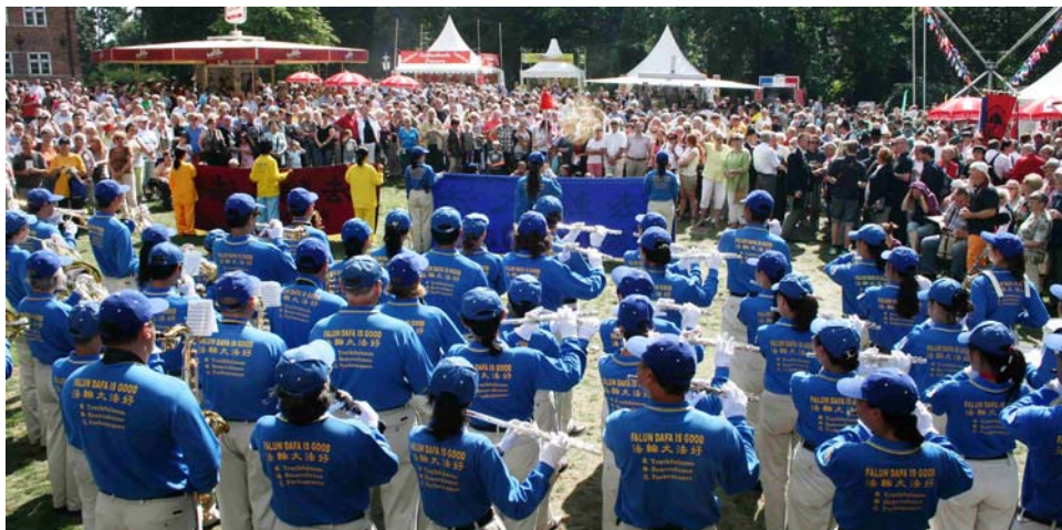
欧洲天国乐团在贝格尔多夫市政厅前演奏，吸引了众多民众的围观。

对佛法正信的迫害不能长久，天惩和审判还在后面。尽管中共还在维持着迫害法轮功的洗脑班和监狱，然而历经 14 年对法轮功的迫害，即使中共内部人员也看明白中共邪恶大势已去，法轮大法正信屹立不倒，法轮功真相广传。◇