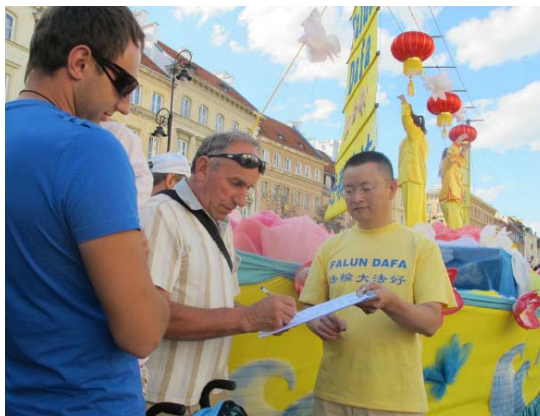
民众签名谴责中共活摘器官

天网恢恢,疏而不漏。江泽民、周永康、罗干、薄熙来等三十多个迫害元凶已在世界数十个国家被法轮功学员以“反人类罪”、“酷刑”或“群体灭绝罪”的万国公罪告上法庭。薄与江氏利用中共国家机器迫害法轮功,其罪恶已与中共捆绑在一起。尽管中共现任当权者出于“保党”仍在掩盖,但在不可阻挡的天象之下,中共邪党正在民众的唾弃声中走向覆灭。在即将到来的天惩和审判面前,每个人的选择决定着自己的未来。◇