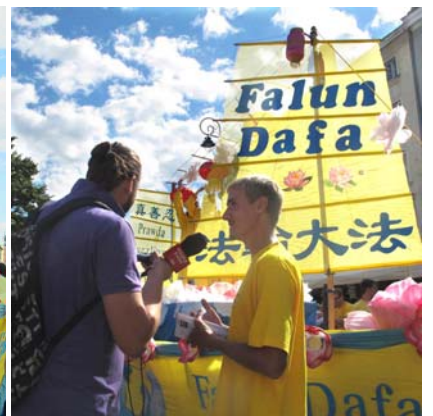
波兰国家媒体采访法轮功学员