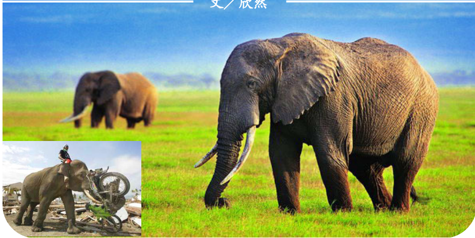
小图：南亚大海啸重灾区，一头大象用鼻子卷起摩托车，帮助清理废墟。

2002年6月，贵州省平塘县掌布乡“藏字石”现世。巨石断面显现出六个大字“中国共产党亡”，媒体报道，经多批中国最权威的地质、古生物专家考证，石龄已有2.7亿年，字乃海绵、海百合茎、腕足类等古生物化石“浑然天成”。