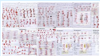
已有 897 位乡亲签名、按手印， 呼吁立即释放好人葛秀丽。

杨中耿（又名张阳），38 岁，浙江省瑞安市法轮功学员，十多年前曾遭当地警察酷刑残害，死里逃生。2013 年 6 月 24 日在郑州被中共警察绑架，仅四天就被活活打死。他母亲看到儿子被迫害的惨状，精神受到极大刺激，悲伤、惊吓过度，昏了过去，至今不会说话。三门峡灵宝市 610（中共专门迫害法轮功的特务组织）为掩盖罪恶，竟然企图诬陷杨中耿是“自杀”。中共当局的欺骗和残暴凸显。◇