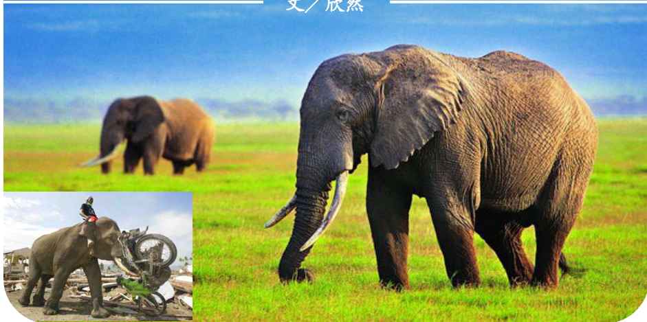
小图：南亚大海啸重灾区，一头大象用鼻子卷起摩托车，帮助清理废墟。

2002年6月，贵州省平塘县掌布乡“藏字石”现世。巨石断面显现出六个大字“中国共产党亡”，媒体报道，经多批中国最权威的地质、古生物专家考证，石龄已有2.7亿年，字乃海绵、海百合茎、腕足类等古生物化石“浑然天成”。